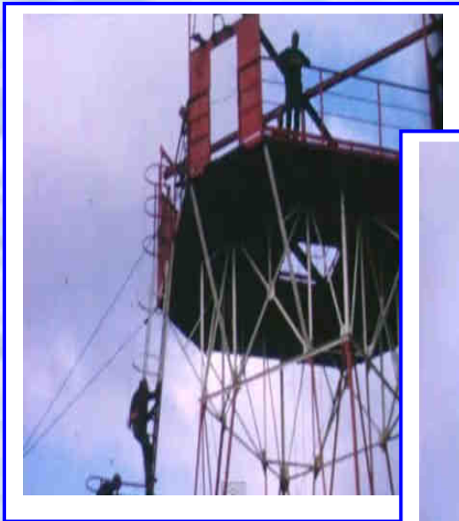
Méditation durant la montée au ciel