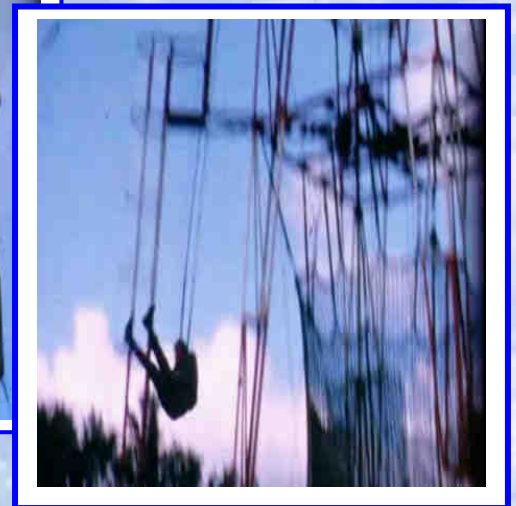
...Suivi d'une remontée de ...bretelles