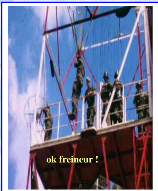
La tour d'arrivée